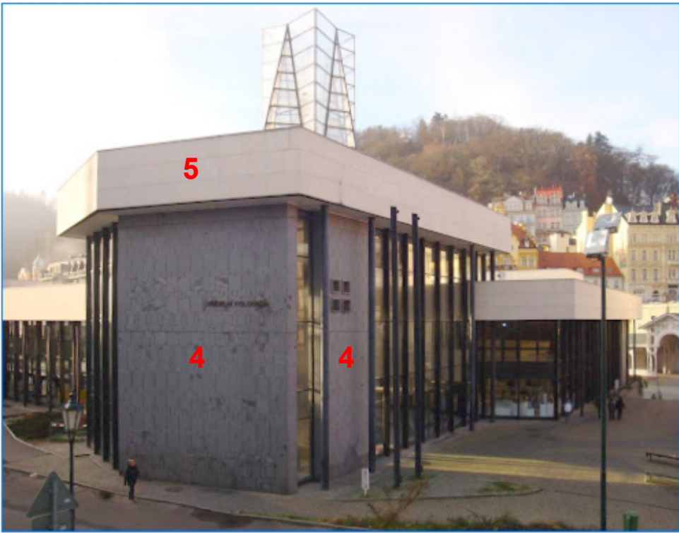
vnější pohled na vřidelní halu severovýchodní stěny se žulovým obkladem a koruna z vápence